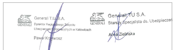
Pieczęć, podpis Ubezpieczyciela